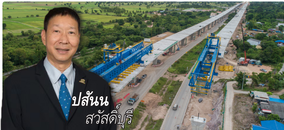
ปล้น สวัสดิ์บุรี

นิวิศ คอนเน็คท์ - NWR ปี 63 การณ์รายได้โต 25-30% หลังสะสมงานในมือกว่า 2.95 หมื่นล้านบาท สูงสุดเป็นประวัติการณ์ แถมได้ปัจจัยหนุนจาก "แอ็ดวานซ์ ฟริแพบ" คาดมีรายได้ไม่ต่ำกว่า 2 พันล้านบาท ขณะที่ช่วงครึ่งปีหลังรอดติดตามงานประมุลกว่า 4 หมื่นล้านบาท